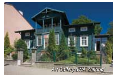
Art Gallery BWA 'Zielona'