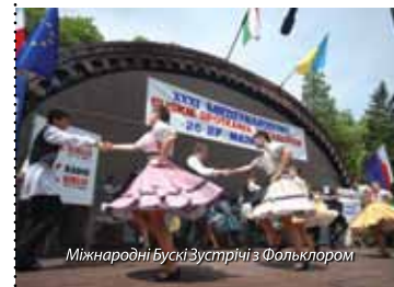
Міжнародні Бускі Зустрічі з Фольклором

них об'єднань, виступи фольклорних колективів супроводжуються столами суто заставленими регіональними смаколикками. Ця подія - неповторний шанс глибшого пізнання культурної спадщини регіону Понідщини.