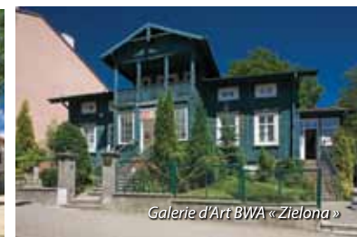
Galerie d'Art BWA « Zielona »