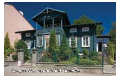
Галерея Мистецтва БВА «Зелена»

• Міська та гмінна громадська бібліотека в Буско-Здруй os. Świerczewskiego 17 тел. + 48 41 370 51 60