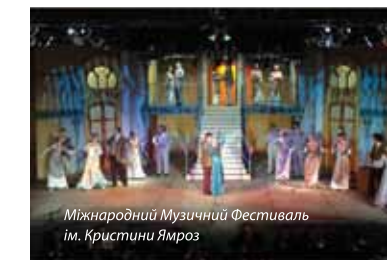
Міжнародний Музичний Фестиваль ім. Кристини Ямроз

Як Париж мав свого горобчика (Едіт Піаф), так Буско – свого солов'я - Кристину Ямроз. Та надзвичайно здібна оперна співачка була родовитою Бушанкою. Народилась 29 серпня 1923 року Своєю музичну освіту розпочала від науки гри на роялі, а під час війни брала уроки співу у Варшаві. Надзвичайно талановита співачка прославилася на польській і закордонній сцені драматичним сопрано з багатою звуковою матерією. Дебютувала в 1946 році на сцені Вроцлавської Опери. Пізніше була зіркою Познанської Опери і Національної Опери у Варшаві. Її найбільш відомі ролі (Галька, Аїда, чи Матка Іоанна в Дияволах з Лудун) принесли їй розголос в країні і закордоном. З 1960 року давала численні концерти в державах колишнього СРСР, Болгарії, Угорщині, в Туреччині і Румунії. У 70 роках. прийшов час на підбій Сполучених Штатів, в яких успіх їй принесли сольні концерти і сопранова партія в II Симфонії Малера.