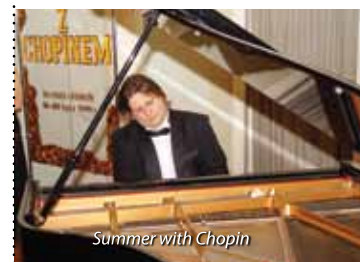
Summer with Chopin

In July the Busko spa is dominated by classical music thanks to the Summer with Chopin festival which is cyclically organised here. 'Bath guests' are captivated by compositions for piano by Frederic Chopin and other virtuosos. Dignified polonaises, lively mazurkas, nostalgic ballades, classical sonatas and fractal rondos can be heard in the Concert Hall of the 'Marconi' Sanatorium. Music by Chopin is played both by recognised musicians and young artists. Concerts have a medicinal influence on spa visitors serving as a basis of music therapy.