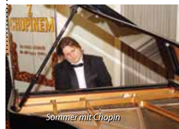
Sommer mit Chopin

Der Juli im Busker Kurort wird von klassischer Musik beherrscht. Ein Beweis dafür ist das zyklisch organisierte Festival Sommer mit Chopin . Die Klavierstücke von Friedrich Chopin und anderer Virtuosen - sind Honig für die Seele der „Badegäste“. Erhabene Poloniasen, sprunghafte Mazurka, nostalgische Balladen, klassische Sonaten und fraktale Rondos lassen sich aus dem Konzertsaal des Sanatoriums „Marconi“ vernehmen. Die Musik Chopins erklingt unter den Fingern sowohl hervorragender Musiker, als auch junger Künstler. Die Auftritte bewähren sich auch in der Behandlung der Kurgäste als Grundlage der Musiktherapie.