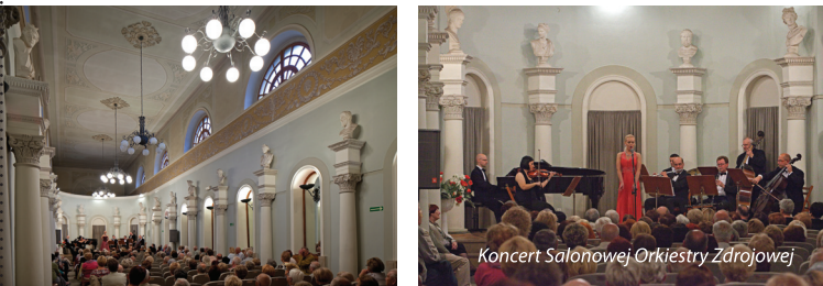
Koncert Salonowej Orkiestry Zdrojowej

Centrum, a w pozostałe dni tygodnia – w sanatoriach „Marconi”, „Nida-Zdrój”, „Włókniarz” i w 21. Wojskowym Szpitalu Uzdrawiskowo-Rehabilitacyjnym. SOZ bierze także czynny udział w Festiwalu Muzycznym imienia Krystyny Jamroz.