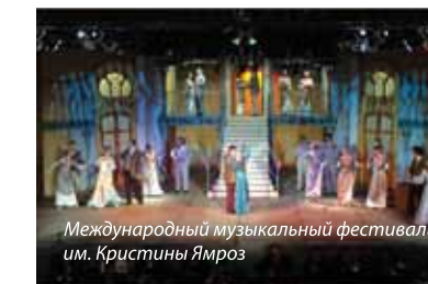
Международный музыкальный фестиваль им. Кристины Ямроз

Как у Парижа был свой воробей (Этит Пиаф), так у Буска – свой соловей – Кристина Ямроз. Эта очень талантливая оперная певица была коренной жительницей г. Буско. Она родилась 29 августа 1923 г. Музыкальное обучение начала с учебы игре на фортепьяно, а во время войны, посещала также в Варшаве уроки пения. Очень талантливая артистка прославилась в Польше и за рубежом как драматическое сопрано, отмеченное большой вокальной силой и широтой диапазона. Она дебютировала в 1946 г. на подмостках Вроцлавской оперы (Opera Wrocławska). Позже была звездой Познаньской оперы (Opera Poznańska) и Большого театра (Teatr Wielki) в Варшаве. Самые известные роли Ямроз (Галья, Аида или Мать Иоанна в Дьяволах из Людена (Diabłach z Loudun) ) принесли ей известность в стране и за рубежом. С 1960 г. артистка выступала, в частности, в странах бывшего СССР, Болгарии, Венгрии, Турции и Румынии. В 70-е годы пришло время покорять Соединенные Штаты, где она очаровала слушателей сольными концертами и партией сопрано во II Симфонии Маглера.