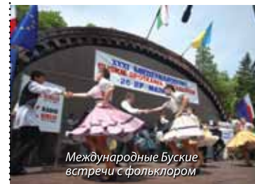
Международные Буские встречи с фольклором

неповторимой возможностью углубленного изучения культурного наследия региона Понидзе.