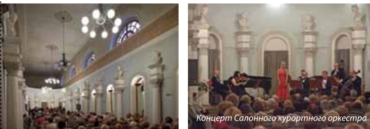
Концерт Салонного курортного оркестра

Тех, кто насытился музыкой, но жаждет дальнейших культурно-эстетических впечатлений, г. Буско-Здруй приглашает посетить галерею, музей, библиотеки, кинотеатр и дом культуры. Богатая программа выставок, по-