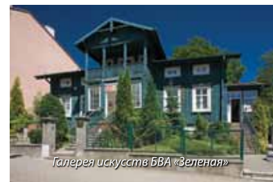
Галерея искусств БВА «Зеленая»