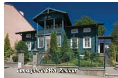
Kunstgalerie BWA „Zielona“