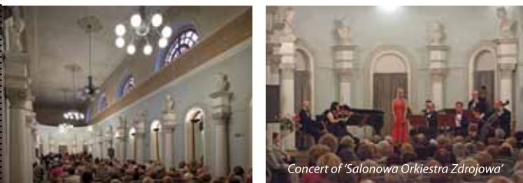
Concert of 'Salonowa Orkiestra Zdrojowa'

Busko Self-Government Centre of Culture (BSCK) to come to concerts of the Orchestra, held every Thursday in the Centre and on the other weekdays – in the sanatoria: 'Marconi', 'Nida-Zdrój', 'Włóknierz' and in the 21 st Military Spa and Rehabilitation Hospital. Salonowa Orkiestra Zdrojowa also actively participates in Krystyna Jamroz Music Festival.