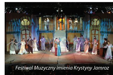
Festiwal Muzyczny imienia Krystyny Jamroz

Jak Paryż miał swojego wróbelka (Edith Piaf), tak Busko – swojego słowika – Krystynę Jamroz. Ta niebywale uzdolniona śpiewaczka operowa była rodowitą buszczanką. Przyszła na świat 29 sierpnia 1923 r. Swoją edukację muzyczną rozpoczęła od nauki gry na fortepianie, a w czasie wojny pobierała także lekcje śpiewu w Warszawie. Wybitnie utalentowana artystka została zapamiętana w Polsce i zagranicą jako sopran dramatyczny o bogatej materii dźwiękowej. Debiutowała w 1946 r. na deskach Opery Wrocławskiej. Później była gwiazdą Opery Poznańskiej i Teatru Wielkiego w Warszawie. Najbardziej wyraziste kreacje Jamroz (Halka, Aida czy Matka Joanna w Diablach z Loudun) przyniosły jej rozgłos i pozwoliły wybrzmieć także poza granicami Polski. Od 1960 r. dawała popisy m.in. na scenach państw byłego ZSRR, Bułgarii, Węgier, Turcji i Rumunii. W latach 70. przyszedł czas na podbój Stanów Zjednoczonych, gdzie olśniewała słuchaczy recitalami i partią sopranową w II Symfonii Mahlera.