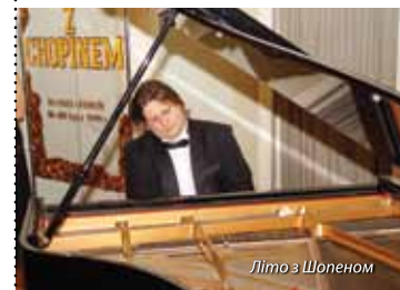
Літо з Шопеном

Липень в бускому курорті проходить під знаком класичної музики. Доказом цьому фестиваль «Літо з Шопеном» , який відбувається щороку. Фортепіанні твори Фредерика Шопена і інших віртуозів – це мед для душі і місцевих жителів і приїжджих. Горді полонези, бравурні мазурки, ностальгічні балади, класичні сонати і фрактальні рондо лунають в Концертному Залі Санаторію «Марконі». Виступи здають екзамен в лікуванні курортників, як основа музикотерапії.