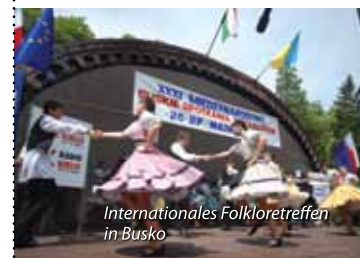
Internationales Folkloretreffen in Busko

sondern auch... die Mägen der Zuhörer. Durch die Vereine der Landfrauen und regionalen Vereinigungen, die ihre Spezialitäten auf bunten Ständen ausstellen, ist die Folklore auch auf dem Gaumen der Musikliebhaber zu Gast. Dieses Ereignis ist eine einmalige Gelegenheit, um sein Wissen über die Kulturerbschaft der Region von Ponidzie zu vertiefen.