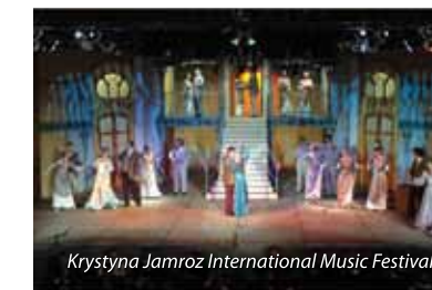
Krystyna Jamroz International Music Festival