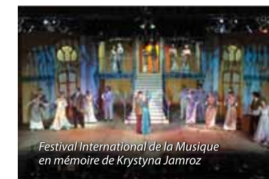
Festival International de la Musique en mémoire de Krystyna Jamroz

Comme Paris avait son piaf (Édith Piaf), Busko a son rossignol – Krystyna Jamroz. Cette cantatrice d'opéra extrêmement douée est née à Busko, le 29 août 1923. Elle a commencé son éducation musicale par les cours de piano. Pendant la guerre, elle prenait des cours de chant à Varsovie. Elle est devenue célèbre sur les scènes nationales et étrangères grâce à son soprano dramatique présentant une matière sonore riche. Jamroz a débuté en 1946 à l'Opéra de Wrocław. Avec le temps, elle est devenue la star de l'Opéra de Poznań et du Grand Théâtre de Varsovie. Ses rôles les plus caractéristiques (Halka, Aïda ou Mère Jeanne dans les Diables de Loudun) lui ont apporté la reconnaissance en Pologne et à l'étranger. A partir de 1960, elle donnait des concerts dans les états de l'URSS, en Bulgarie, Hongrie, Turquie ou Roumanie. Dans les années 70, Jamroz est partie à la conquête des États-Unis où elle a émerveillé les spectateurs par ses récitals et par sa soprano dans la Symphonie de Mahler n° 2. Pendant trente quatre ans de carrière,