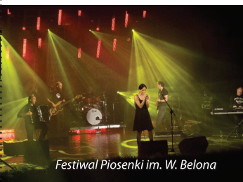
Festiwal Piosenki im. W. Belona

Poniżej przedstawiamy krótką charakterystykę najgłośniejszych imprez cyklicznych Buska-Zdroju, które rozślawiły miasto nie tylko w kraju, ale i w Europie.