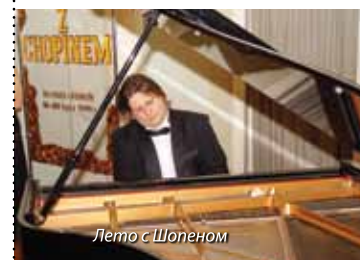
Лето с Шопеном

Июль на курорте звучит классической музыкой. Доказательством этого является, организуемый циклически фестиваль Лето с Шопеном (Lato z Chopinem) . Произведения для фортепьяно Фридерика Шопена и других виртуозов – это бальзам для души курортников. Достойные полонезы, бравурные мазурки, ностальгические баллады, классические сонаты и фрактальные рондо звучат в Концертном зале Санатория «Маркони» (Sanatorium „Marconi”). Музыка Шопена льется из-под пальцев известных музыкантов и молодых артистов. Выступления помогают лечить курортников и являются основой музыкотерапии.