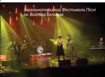
Загальнопольський Фестиваль Пісні ім. Войтка Бельона

Нижче представляємо коротку характеристику найвідоміших циклічних заходів Буско-Здрой, завдяки яким місто відоме не лише в Польщі але й в усій Європі.