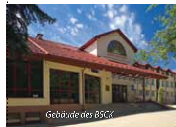
Gebäude des BSCK

al. Mickiewicza 22 Tel.: +48 41 378 35 72 www.bsck.busko.pl/pl/kino-zdroj.html