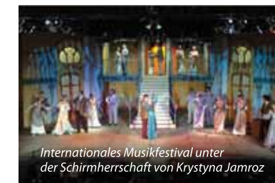
Internationales Musikfestival unter der Schirmherrschaft von Krystyna Jamroz

Wie Paris seinen Sperl (Edith Piaf), so hat Busko – seine Nachtigall – Krystyna Jamroz. Diese außergewöhnlich begabte Opernsängerin war geborene Buskerin. Sie kam am 29. August 1923 zur Welt. Ihre musikalische Ausbildung begann sie mit dem Klavierunterricht, und in der Kriegszeit bezog sie auch Gesangsunterricht in Warschau. Die ausgesprochen talentierte Künstlerin wurde auf polnischer und ausländischer Bühne als dramatischer Sopran mit einer reichen Klangmaterie berühmt. Ihr Debüt hatte sie im Jahre 1946 auf der Bühne der Breslauer Oper. Später war sie ein Star der Oper von Posen und des Großen Theaters in Warschau. Ihre ausdrucksvollsten Rollen (Halka, Aida oder Mutter Joanna in den Teufel aus Loudun) brachten ihr Popularität im In- und Ausland. Seit 1960 gab Sie Vorführungen in den Ländern der ehemaligen Sowjetunion, in Bulgarien, Ungarn, der Türkei und Rumänien. In den 70-er Jahren kam die Zeit die Vereinigten Staaten zu erobern, wo sie die Zuhörer mit ihren Recitals und Sopranpartien in der II Symphonie von Mahler verzauberte. In ihrer vierunddreißig jährigen Karriere machte sie sich auch