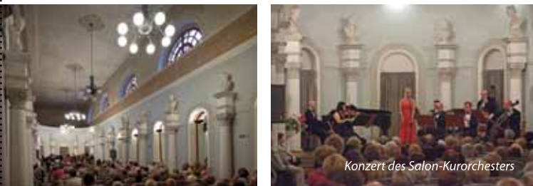
Konzert des Salon-Kurorchesters

Behandlungen entspannen und der klangvollen Schönheit der Musiknoten hingeben möchten, lädt das BSCK zu den Auftritten des Orchesters ein, die jeden Donnerstag im Zentrum und an den übrigen Wochentagen - in den Sanatorien „Marconi“, „Nida-Zdrój“, „Włókniarz“ und im 21. Militärischen Kur- und Rehabilitationskrankenhaus stattfinden. Das Salon-Kurorchester nimmt auch aktiv am Musikfestival unter der Schirmherrschaft von Krystyna Jamroz Teil.