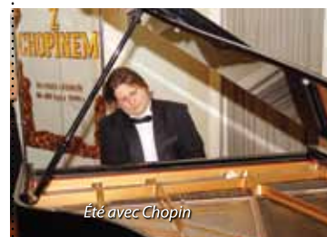
Été avec Chopin

A la station thermale de Busko, le mois de juillet est consacré à la musique classique. Le festival Été avec Chopin en est la preuve. Les œuvres pour piano de Frédéric Chopin et d'autres compositeurs – émerveillent les curistes. Des polonaises honorables, des mazurkas sautillantes, des ballades nostalgiques, des sonates classiques et des rondos à fraction : le son remplit la salle de concert du Sanatorium Marconi. La musique de Chopin s'éveille sous les doigts d'éminents musiciens et de jeunes créateurs. Ces concerts sont bénéfiques aux curistes et constituent le fondement de la musicothérapie.