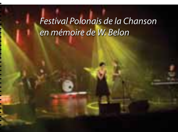
Festival Polonais de la Chanson en mémoire de W. Belon

Voici une brève présentation de principales manifestations culturelles à Busko-Zdrój qui ont rendu cette ville fameuse non seulement en Pologne, mais aussi en Europe.