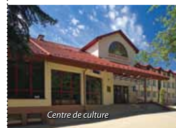
Centre de culture

allée Mickiewicza 22 tél. +48 41 378 35 72 www.bsck.busko.pl/pl/kino-zdroj.html