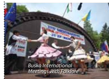
Busko International Meetings with Folklore

Clubs and regional associations presenting their delicacies on vivid stands folklore is also present on music lovers' palates. This event is a unique opportunity to thoroughly get to know cultural heritage of the Ponidzie region.