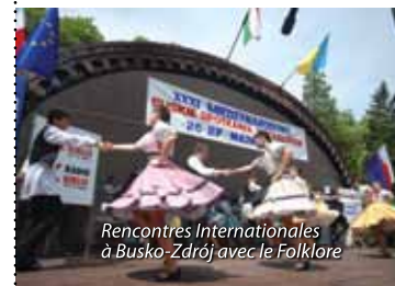
Rencontres Internationales à Busko-Zdrój avec le Folklore

pleins de couleurs, le folklore arrive aux palais des mélomanes. C'est une manifestation à ne pas manquer, incontournable pour ceux qui souhaitent approfondir leur connaissance du patrimoine culturel de la région de Poniidzie.