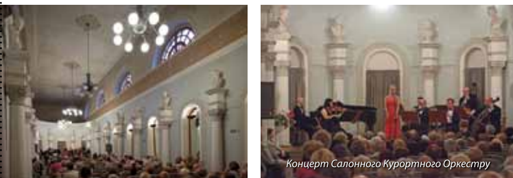
Концерт Салонного Курортного Оркестру

таційно-Курортну Лікарню. Салонний Курортний Оркестр бере теж активну участь в Міжнародному Музичного Фестивалі імені Кристини Ямроз.