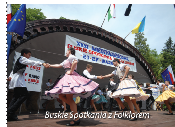
Buskie Spotkania z Folklorem

wystawiających swoje specjały na barwnych stanowiskach, folklor gości bowiem także na podniebieniu melomanów. Wydarzenie to jest niepowtarzalną okazją do zgłębienia dziedzictwa kulturowego regionu Poniądzia.