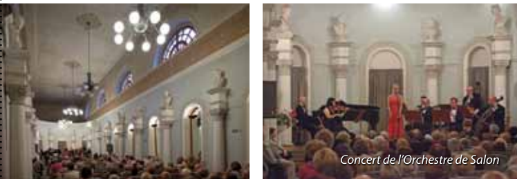
Concert de l'Orchestre de Salon

duits aux sanatoriums : Marconi, Nida-Zdrój, Włókniarz et au 21 Hôpital Militaire de Cure et de Réhabilitation. L'Orchestre de Salon participe activement au Festival de la Musique en mémoire de Krystyna Jamroz. En outre, la ville de Busko-Zdrój invite tous les amateurs de la musique