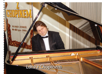
Lato z Chopinem